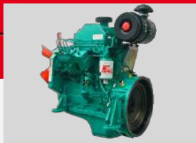
CUMMINS MODEL: 4B3.9-G12