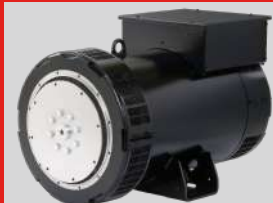
LEROY SOMER MODEL: TAL-A46-C