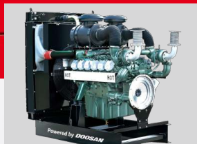
DOOSAN MODEL: DP086LA