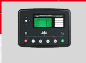
DEESEA MODEL: DSE7320