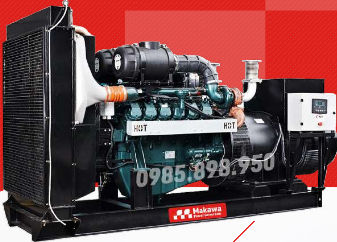
Máy trần |