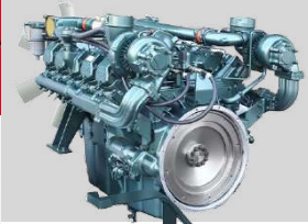
DOOSAN MODEL: DP180LB