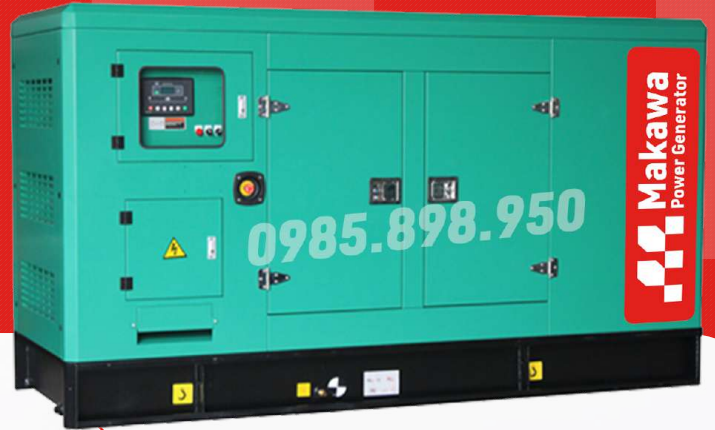
Máy có vỏ chống ồn

Công ty TNHH TBCN MAKAWA hân hạnh gửi đến Quý cơ quan các đặc tính kỹ thuật máy phát điện của hãng model MKW-635DS như sau: